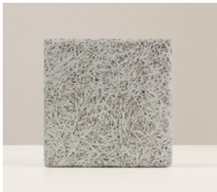
Gris Medio Fibra fina de abeto con cemento pintado color Gris Medio. Biselado. Medida 29 x 29 x 2,5 cm