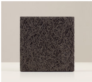
Antracita Fibra fina de abeto con cemento pintado color gris Antracita. Biselado. Medida 29 x 29 x 2,5 cm