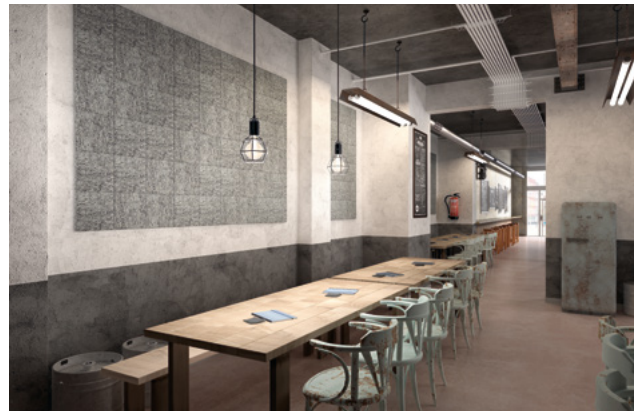
Legnomuro Abeto Portland