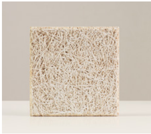
Abeto Natural Fibra fina de abeto con cemento blanco. Biselado. Natural. Ideal para pintar. Medida 29 x 29 x 2,5 cm