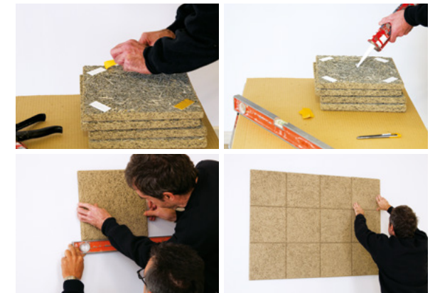
Instalación limpia, rápida, fácil y segura.