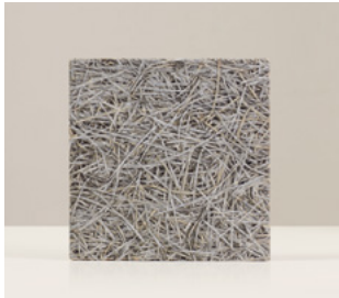
Abeto Portland Fibra gruesa de abeto con cemento Portland. Sin biselar. Medida 29 x 29 x 2,5 cm