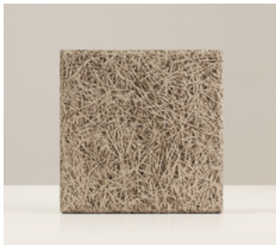
Tabaco Fibra fina de abeto con cemento pintado color Tabaco. Biselado. Medida 29 x 29 x 2,5 cm