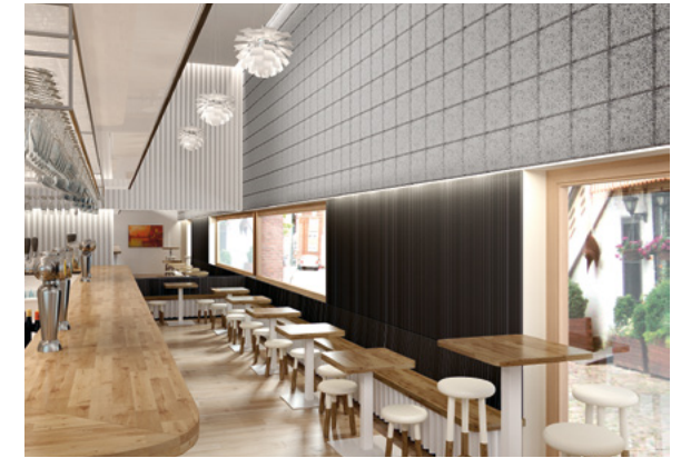
Legnomuro Gris Medio