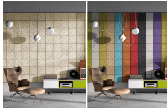
Legnomuro Abeto Natural